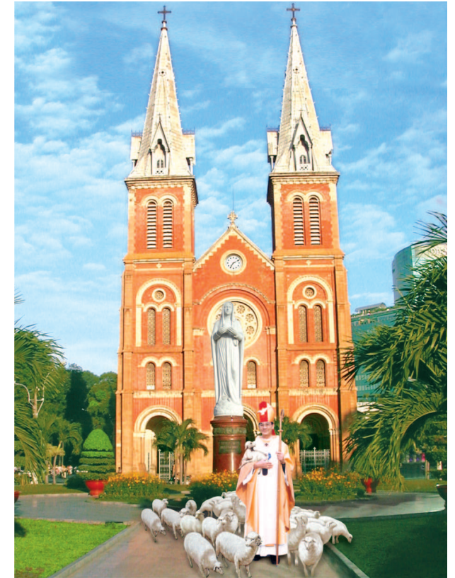
GB. PHẠM MINH Mẫn Hồng Y Tổng Giám Mục